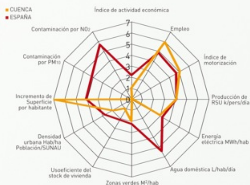
Diagrama de Sostenibilidad.

Cuenca tiene un amplio término municipal, 921 km 2 , sólo el 8% de la superficie es artificial frente al 73% que tiene alguna figura de protección ZEPa, LIC y ENP.